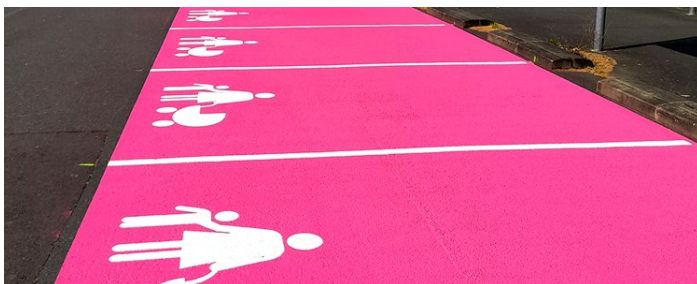
Marquage au sol de places de stationnement réservées aux familles