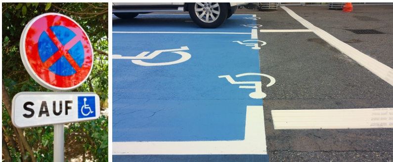
Exemple de signalétique verticale et marquage au sol des places de stationnement adaptées

Photos illustrant des places de stationnement adaptées