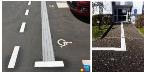
Bande de guidage